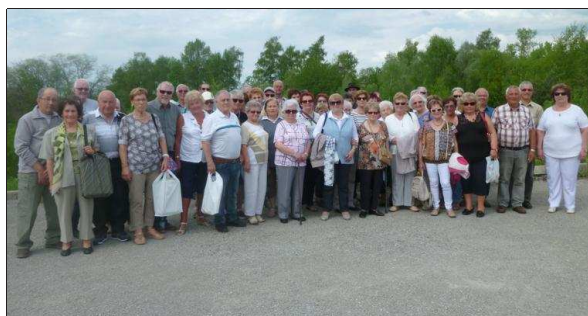
Cette sortie de "Plaisir de vivre" ne laissera que de bons souvenirs.

Le club "Plaisir de vivre" de Saint-Pierre a récem- ment fait sa sortie annuel- le fête des mères et pères en bus et en bateau. Après avoir grimpé Les Rousses, le bus s'est arrêté pour une pause casse-croûtes très appréciée.