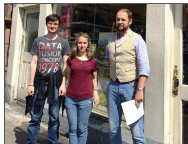
Les étudiants de retour avec leur maître de stage.